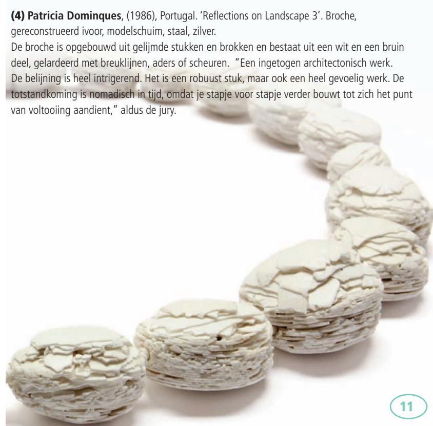
(4) Patricia Dominques, (1986) Portugal "Reflections on Landscape 3", Reconstructed ivory, foam, steel, silver. The brooch consists of a white and a brown part interlaced with fault lines, veins or fissures. It is composed of bits and pieces glued together. "A subdued architectonic work. The lineation is quite intriguing. It is a robust, but at the same time very sensitive work. The creation is nomadic in time, because you keep building step by step until the point of completion is there".